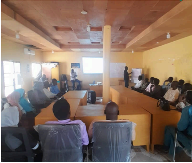
Formation des enquêteurs et agents de services déconcentrés l'Etat à Hadjer Hadid

Le processus du ciblage communautaire a démarré le mois de Juillet par un développement d'une méthodologie de ciblage géographique et communautaire des bénéficiaires. Ceci a été suivi en octobre 2023 par une formation organisée par le partenaire IRC dans les trois provinces. Ces formations sur la méthodologie stratégique et opérationnelle de ciblage ont été facilitées par le conseiller technique de partenaire et les agents de Concern worldwide. 99 personnes composées des enquêteurs et des agents de services déconcentrés de l'état dans les trois provinces ont été formés sur les techniques de ciblage communautaire avec l'approche HEA et la collecte de données avec le système CommCare