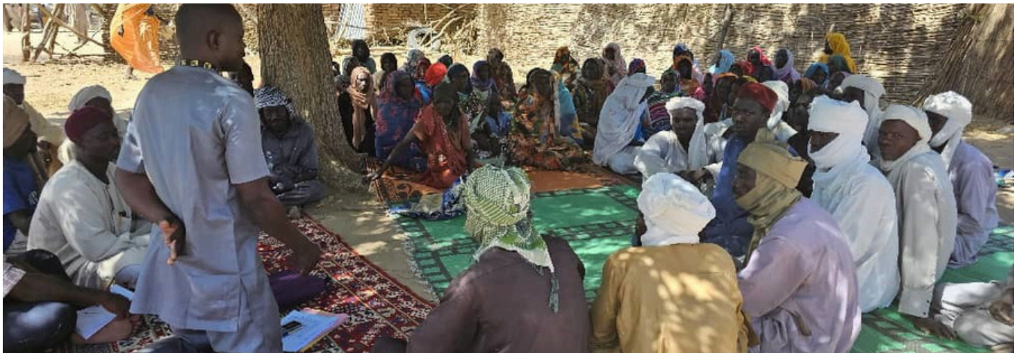
Restitution des résultats du ciblage communautaire au village Sira, Sous-prefecture de Hadjer Hadid, Province du Ouaddaï,

Dans le but de rendre compte aux autorités et aux communautés bénéficiaires, l'équipe du programme RESPECCT, après le traitement et nettoyage de la base des données de ciblage communautaire a organisé une autre mission, au cours de laquelle, des séances de restitution des résultats de ciblage communautaire ont été faites dans les bureaux de : Gozbeida, Hadjer et Iriba auprès des autorités administratives et dans les villages afin d'apprécier le feedback des communautés sur les listes des bénéficiaires sélectionnés et prendre en compte les cas de plaintes s'il y en a. Ces séances ont été tenues dans la période du 22 novembre 2023 au 04 décembre 2023