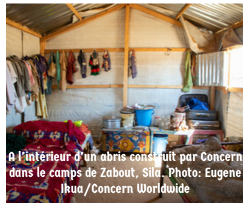
A l'intérieur d'un abris construit par Concern dans le camps de Zabout, Sila.

Parallèlement aux activités du ciblage géographique et communautaire, le programme a assisté avec des abris d'urgence 1 500 personnes réfugiés soudanais arrivées dans la province de Sila suite à la guerre au soudan. Cette intervention a été possible grâce au fonds d'urgence « Crisis modifier ».