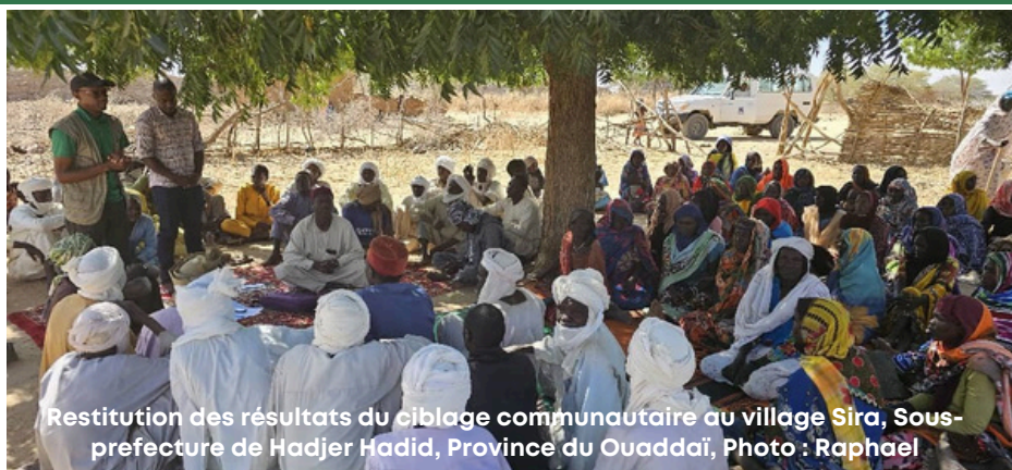
Restitution des résultats du ciblage communautaire au village Sira, Sous-préfecture de Hadjer Hadid, Province du Ouadaï, Photo : Raphaël