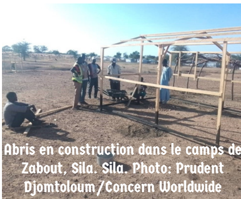
Abris en construction dans le camps de Zabout, Sila.