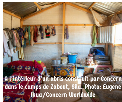
A l'intérieur d'un abris construit par Concern dans le camps de Zabout, Sila.

Parallèlement aux activités du ciblage géographique et communautaire, le programme a assisté avec des abris d'urgence 1 500 personnes réfugiés soudanais arrivées dans la province de Sila suite à la guerre au sudan. Cette intervention a été possible grâce au fonds d'urgence « Crisis modifier ».